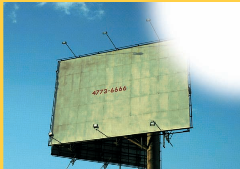
WHITE LIGHT #2 (Serie Emergencia). 100 x 70 cm. Fotografía digital láser. 2007