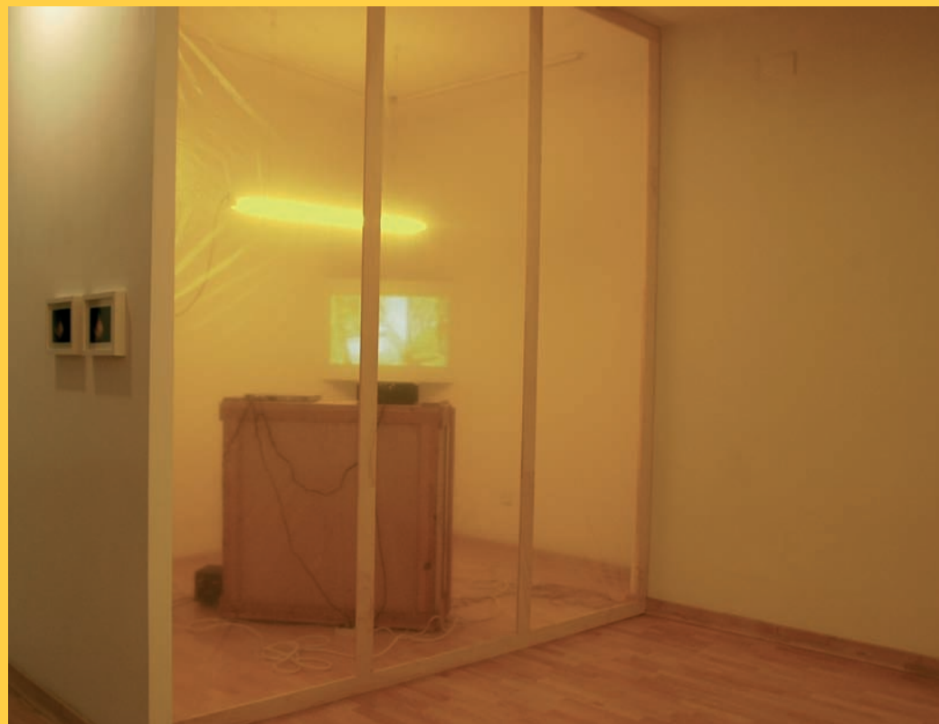
INTIMIDAD. M. variables. Instalación, vídeo, sonido, luz, plástico, madera. 2006/08