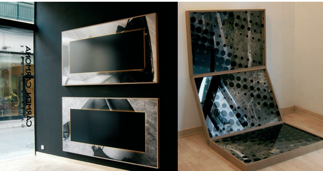
EMERGENCIA #1, #4 (Serie Emergencia). 200 x 100 cm. Fotografía digital láser. 2006/07

En "El Resplandor" se pueden apreciar versiones de esa "obturación del ojo" a través de imágenes que impiden voluntariamente establecer una "conexión" correcta con el receptor. Es el caso de "Hay una gran ola negra en mitad del mar" donde el tramado ampliado de una mano se superpone a tres paisajes fotografiados (en una referencia sui generis a los tres niveles lacanianos y la famosa malla). Los rectángulos auráticos de "Emergencia" o la presencia de la luz en las piezas "White Light" actúan como barreras que obstaculiza la plena percepción ofreciéndonos relatos cortocircuitados, amputados de su totalidad. "Bellas ideas que no sirven para nada" proporciona la desorientación perceptiva al no existir referentes específicos, como en la instalación "Intimidad", en la que el espacio representado y filmado queda aislado literalmente del espectador a través de unos ventanales forrados de plástico translúcido.